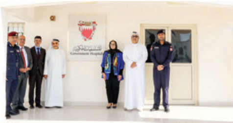
○ خلال افتتاح العيادة، أريفيية..

وزير الداخلية ووكيل الوزارة والإدارات ذات الصلة بمراكز الإصلاح والتأهيل، لتحسين وتطوير الخدمات المقدمة للنزلاء، منها خدمات الرعاية الصحية بحيث تكون على نفس درجة الخدمات المقدمة للمواطنين الآخرين خارج المركز، ومن خلال الاستعانة بالكوادر المتخصصة في وزارة الصحة والتي تعمل ضمن نفس آليات العمل في المراكز والمستشفيات الخارجية التابعة للوزارة، الأمر الذي من شأنه دعم الرعاية الصحية والطبية المقدمة للنزلاء ضمن النظام الإلكتروني لسوزارة ككل، ومن ثم تتيح للنزلاء نفس فرص العلاج والتطبيب المتاحة لكافة المواطنين في المجتمع، وهو الأمر الذي يتسق أيضا مع قانون الضمان الصحي المزمع تطبيقه قريبا.