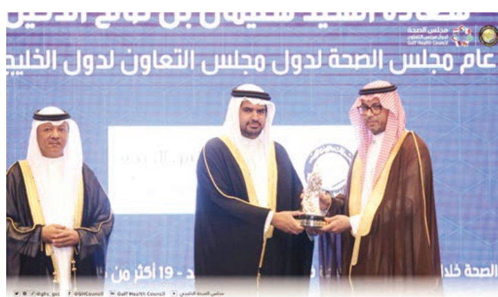
○ خلال تسلم الجائزة.