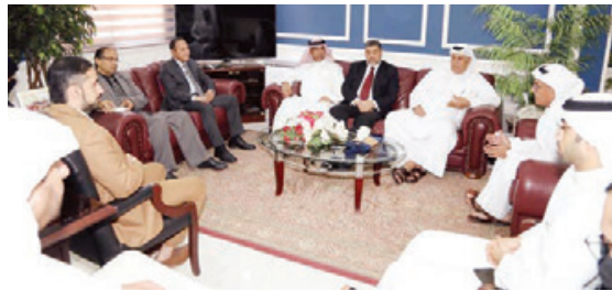
○ محافظ الشمالية خلال استقبال أعضاء مكتب منسق المدن الصحية.

التي وضعتها منظمة الصحة العالمية، ما أهلها للاختيار لتكون أولى محطات المدن الصحية في المحافظة الشمالية، حيث مثلت قصة نجاح وانطلاقة نحو اعتماد الشمالية محافظة صحية، مؤكداً أنه قد تم تشكيل لجان عمل منبقة من اللجنة العليا برئاسة ممثلي أصحاب الخبرات المتخصصة في معايير الاعتماد، حيث يعدون كسبا كبيراً للمحافظة وبرامجها القادمة للمدن الصحية، وأن اعتماد عالي هو بداية الطريق وترسيخ لاستمرارية العمل وتكثيف البرامج التي تساهم في الصحة المجتمعية وانعكاساتها على الأهالي لتعزيز نظام الوقاية الصحية تحت شعار «الصحة للجميع ومن الجميع».