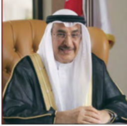
الشيخ خالد بن عبدالله آل خليفة

أكد مجلس الوزراء في جلسته أمس، برئاسة الشيخ خالد بن عبدالله آل خليفة نائب رئيس مجلس الوزراء ووزير البنية التحتية أن مملكة البحرين تنظر للسلام كخيار استراتيجي يعزز مسارات الأمن ويكرس التعايش السلمي، وذلك في معرض تنويه المجلس باليوم الدولي للسلام. بعدها تابع المجلس آخر مستجدات التصدي للأمراض السارية وتطورات التقصي البوائي عالمياً بشأنها، وكلف وزارة الصحة بمواصلة اتخاذ الإجراءات الاحترازية والوقائية وزيادة الاستعدادات لتعزيز الاستجابة لآية مستجدات بهذا الشأن. وقّر المجلس الموافقة على قرار اللجنة الدائمة لمكافحة الممارسات الضارة في التجارة الدولية لدول مجلس التعاون بفرض رسوم الإغراق ضد واردات دول مجلس التعاون لعدد من المنتجات. ووافق على مذكرة تفاهم بين كلية البحرين التقنية «بوليتكنيك» وجامعة شاندونغ جياوتونغ الصينية في مجال التعليم وبناء القدرات التعليمية والمهنية. واستعرض المجلس مذكرة وزير النفط والبيئة بشأن نظام لرصد الانبعاثات الصادرة عن المصانع والمنشآت الصناعية.