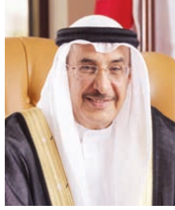
○ الشيخ خالد بن عبدالله.

اتخذته وزارة التنمية الاجتماعية لتنفيذ توجيه سموه حول تقييم ودراسة المعايير ووضع الضوابط الخاصة باستحقاقهم العلاوة. وأكد المجلس أن مملكة البحرين تنظر إلى السلام كخيار استراتيجي يعزز مسارات الأمن ويكرس التعايش السلمي، وذلك في معرض تنويه المجلس باليوم الدولي للسلام. وتابع المجلس آخر مستجدات التصدي للأمراض السارية وتطورات التقصي الوبائي عالميا بشأنها، وكلف وزارة الصحة بمواصلة اتخاذ الإجراءات الاحترازية والوقائية وزيادة الاستعدادات لتعزيز الاستجابة لأية مستجدات بهذا الشأن. واستعرض المجلس مذكرة وزير النفط والبيئة بشأن نظام لرصد الانبعاثات الصادرة عن المصانع والمنشآت الصناعية.