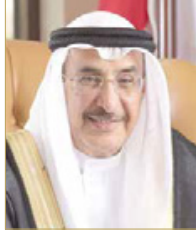
الشيخ خالد بن عبدالله

وكلف وزارة الصحة بمواصلة اتخاذ الإجراءات الاحترازية والوقائية وزيادة الاستعدادات لتعزيز الاستجابة لآلية مستجدات بهذا الشأن.